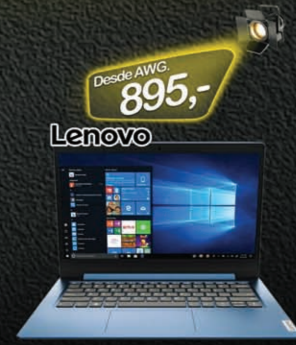
81VU000JUS ICE BLUE